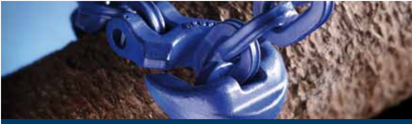
Chokerketten und Forstzubehörteile

pewag Schneeketten GmbH & Co KG A-8020 Graz, Bahnhofgürtel 59 Phone: +43 (0) 316 / 60 70-0 Fax: +43 (0) 316 / 60 70-142 schneeketten@pewag.com www.pewag.com